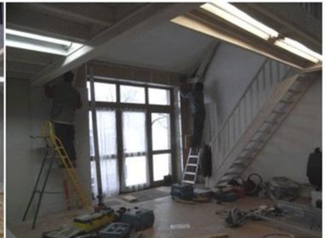
Travaux d'isolation et de peinture dans le local de la plume enchantée à Marlanges.