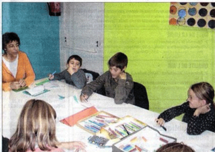
HIER APRÈS-MIDI, AU RÉCRÉATIF CAFÉ. Un atelier d'écriture spontanée a réuni des enfants de 7 à 14 ans. De quoi faire travailler son imagination !

> Contact : www.laplumeenchantee.org ; orleans@laplumeenchantee.org ; 06.65.24.51.63.