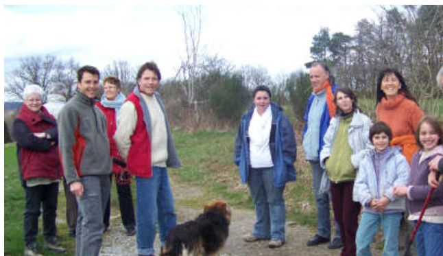
Départ de ballade

Parallèlement, les personnes de l'encadrement se sont affairées à la préparation des salles, à l'élaboration des repas et à l'ensemble des tâches matérielles nécessaires au bon déroulement des journées.