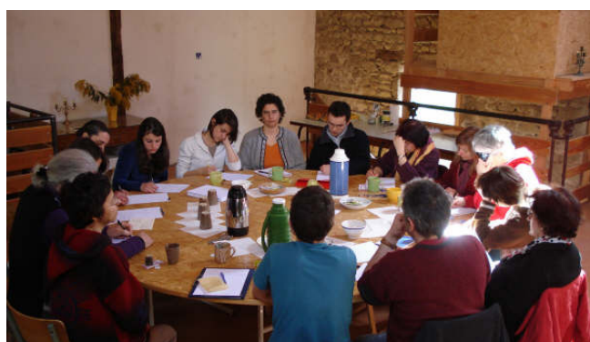
Lors d'un atelier d'écriture

C'est dans le hameau de Marlanges, en Creuse, que se sont déroulées, du 11 au 16 avril 2008, les premières journées de la plume enchantée . Au programme : Ateliers d'écriture et Ressourcement. Une quarantaine de