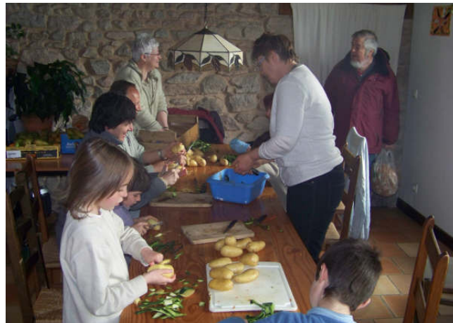
Petits et grands en cuisine au "Chant du Coq"

Atelier d'écriture, puis de théâtre, donnèrent libre cours à l'expression spontanée d'une dizaine d'enfants. Les promenades dans la campagne environnante et le côté paisible et silencieux du lieu comblèrent le besoin de ressourcement de tous. Des soirées musicales, autre espace de créativité et de complicité, permirent la rencontre entre des musiciens de tous âges et un public enthousiaste.